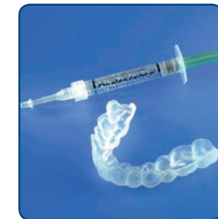
Van de tandarts of mondhygiënist krijg je de doorzichtige bleeklepel en de gel met de blekende werking mee naar huis

Egale, niet te ernstige verkleuringen kun je van buitenaf bleken. Dat gebeurt met behulp van een bleeklepel. Eerst maakt de tandarts of mondhygiënist een afdruk van je gebit. Hiermee maakt de tandtechnicus in het tandtechnisch laboratorium een bleeklepel van een zachte transparante kunststof, die precies over je gebit past en ruimte laat voor de gel. Dat is belangrijk, om irritatie van het tandvlees te voorkomen. De bleeklepel is de mal waarmee je de blekende gel op de tanden aanbrengt. De gel bevat 3 tot maximaal 6% waterstofperoxide. Na een goede instructie hoe je de gel moet aanbrengen en wanneer je de bleeklepel moet dragen, krijg je de bleeklepel en enkele spuitjes bleekgel mee naar huis.