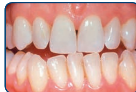
Resultaat na tien dagen bleken met de thuisbleekmethode onder supervisie van de tandarts