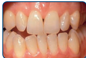
Voor het bleken

De lengte van een bleekbehandeling hangt af van de bleekmethode. Bij de thuisbleekmethode duurt het meestal twee tot drie weken voordat je het gewenste resultaat hebt bereikt. De tandkleur wordt na het beëindigen van de bleekbehandeling altijd weer iets donkerder. Na zes weken kun je pas het echte bleekresultaat zien.